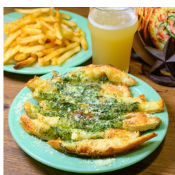
ガーリックノーウッド